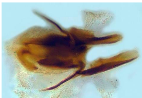
Fig. 5. Escleritos del saco interno de G. platensis . Fig. 5. Sclerites of the internal sac of G. platensis.