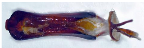
Fig. 4. Vista ventral del edeago de G. platensis . Fig. 4. Ventral view of the aedeagus of G. platensis.

Con todo ello, se confirma que los ejemplares adultos recogidos en este eucalipto de la localidad de Alaró corresponden a G. platensis y que representan el primer registro para Mallorca y para las Islas Baleares, así como su confirmación en el Mediterráneo occidental.