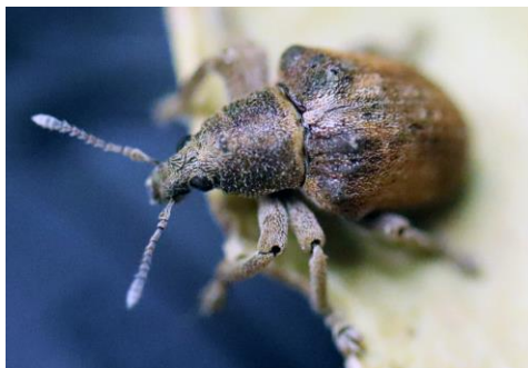
Fig. 3. Vistas dorsal y lateral de los adultos capturados. Fig. 3. Dorsal and lateral views of the captured adults.