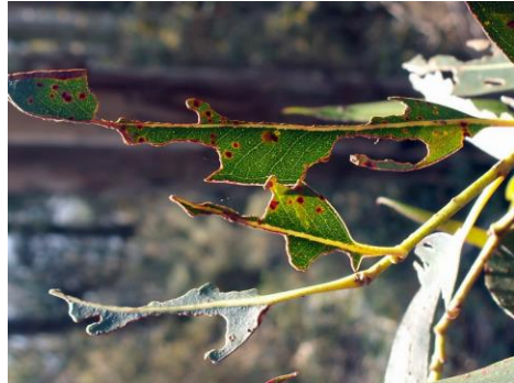
Fig. 2. Daños en hoja por defoliación de los adultos.

Debido a que no se pudo guardar el adulto observado en julio del 2023 y que las fotografías que se realizaron en ese día fueron tomadas a baja resolución, no se pudo estudiar, ni determinar correctamente la especie a la que pertenecía el individuo. Al cabo de unos días, concretamente el 28 de agosto, los técnicos forestales se personaron en el lugar del encuentro (coordenadas 39°42'47.5"N 2°46'18.2"E),