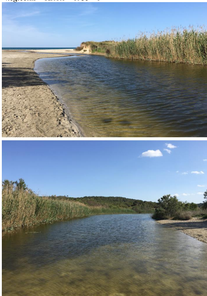
Fig. 1. Estany del Bisbe, torrent de Na Borges (Mallorca), hàbitat de Palaemon varians Fig. 1. Estany del Bisbe, Na Borges stream (Mallorca), habitat of Palaemon varians .

Calanipeda aquaedulcis Kristschagin 1873; els ostràcodes Potamocypris steueri Klie, 1935, Cyprideis littoralis (Brady, 1870), C. torosa (Jones, 1850) i Loxoconcha gauthieri Klie, 1929; l'amfípode Gammarus aequicauda (Martynov 1931); l'isòpode Lekanesphaera hookeri (Leach, 1814) i els decàpodes exòtics Procambarus clarkii (Girard, 1852) i Callinectes sapidus Rathbun, 1896 (WWF España, 2018).