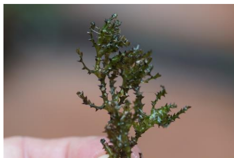
Fig. 5. Najas marina subsp. armata Horn

Hydrocharytaceae. En aquesta localitat l'espècie es distribueix per gran part de la superfície de la llacuna, formant motes de fins 1 metre de diàmetre. L'hàbitat és el característic d'aquesta subespècie (Talavera i Gallego, 2010). Sovint aquesta llacuna no s'eixuga durant l'estiu, aquest fet, les aigües tèrboles i el sòl fangós profund que dificulta l'exploració, podrien explicar que fins ara no s'hi hagués detectat. La planta de Menorca és densament espinosa, amb les fulles curtes, relativament amples i amb les dents molt pronunciades (Fig. 5).