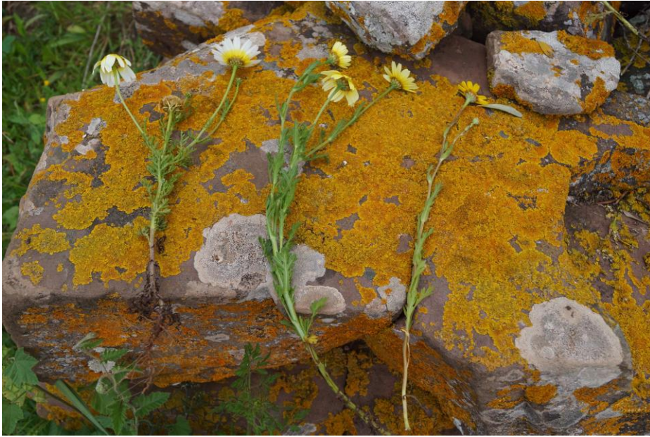
Fig. 3. Individus recol·lectats in situ de Glebionis coronaria (L.) Cass. ex Spach. (esquerra), G. x merinoana (Pau) P. Fraga & C. Mascaró (centre), G. segetum (L.) Fourr. (dreta).