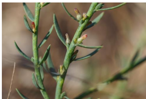
Fig. 6. Thymelaea passerina (L.) Coss. & Germ., detall de les tiges floríferes.

útil per a la seva identificació. Com a indiquen tots aquests autors per altres regions, és molt probable que també a Menorca una part important de les citacions de S. media corresponguin a S. ruderalis . Tanmateix, tant la presència de S. media com de S. neglecta Weihe, queden confirmades a l'illa després d'haver consultat el material d'herbari.