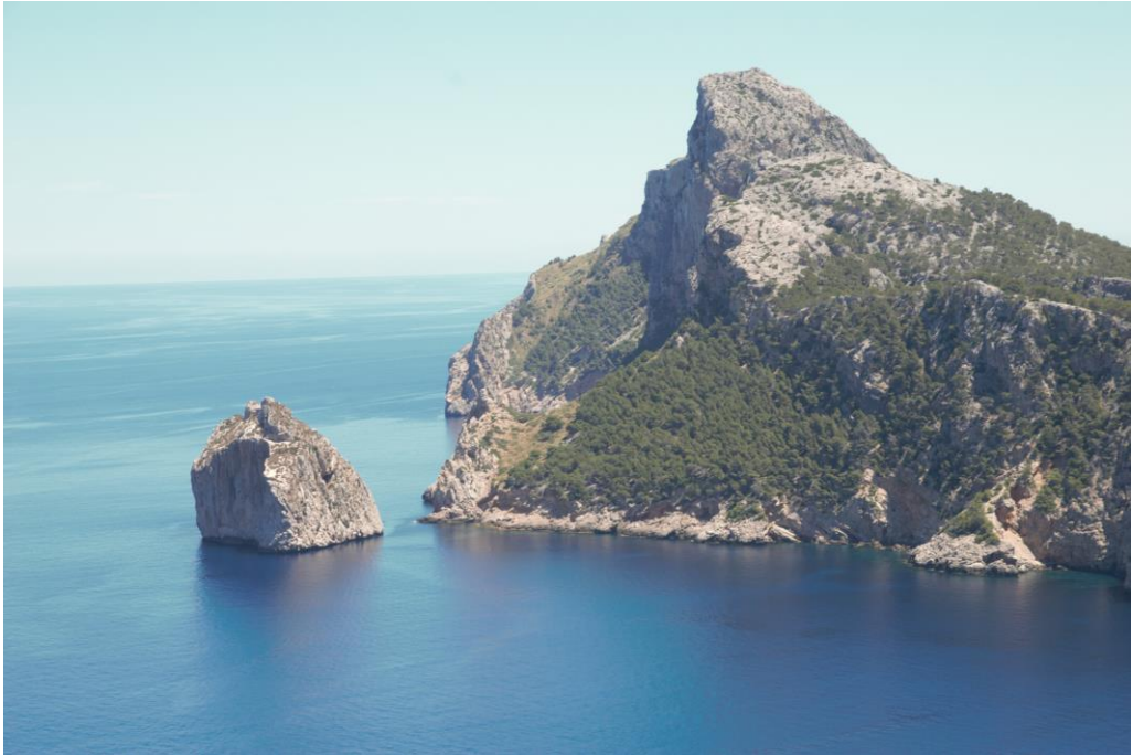
Fig. 2. Illot del Colomer de Formentor.